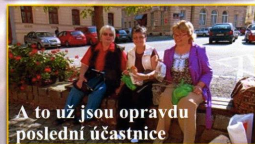
A to už jsou opravdu poslední účastnice