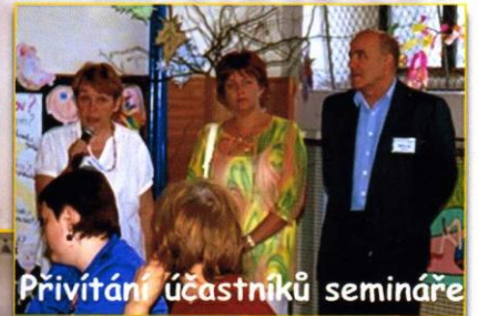
Privítání účastníků semináře