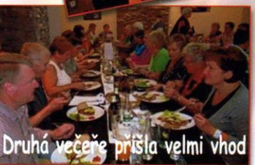
Druhá večere přišla velmi vhod