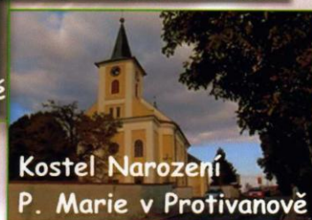
Kostel Narození P. Marie v Protivanově