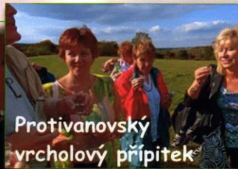
Protivanovský vrcholový přípitek