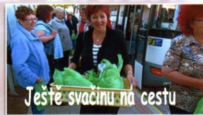
Ještě svačinu na cestu

Vrtule smutně mrká - Protivanov se loučí s účastníky setkání CVKUaM - VII.