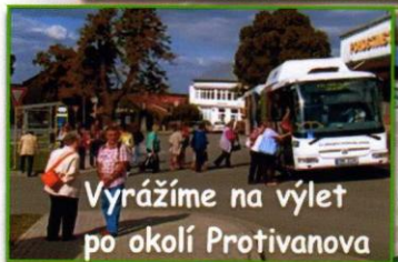
Vyrážíme na výlet po okolí Protivanova