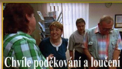
Chvilce poděkování a loučení