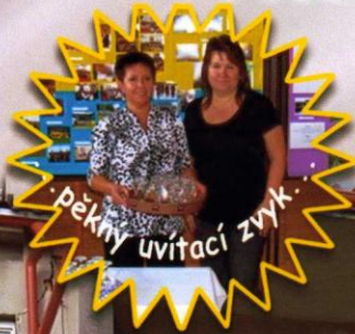
pekný uvítací zvyk.