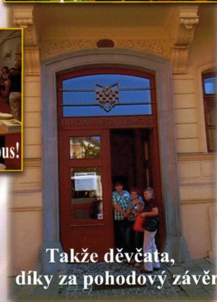
Takže děvčata, díky za pohodový závěr