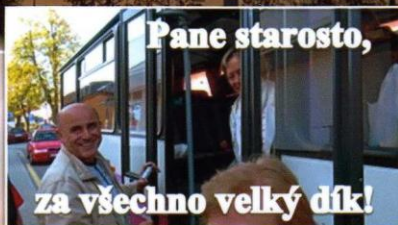
Pane starosto, za všechno velký dík!