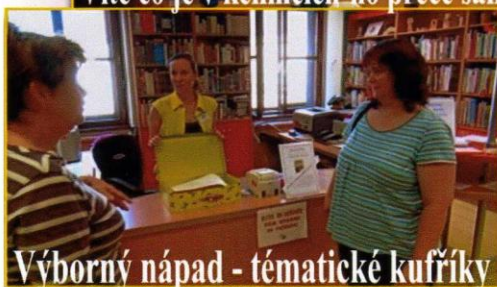
Výborný nápad - tématické kufříky