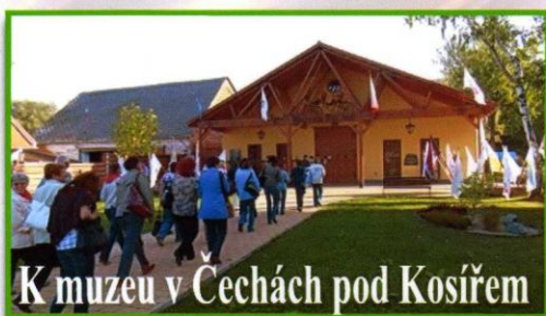
K muzeu v Čechách pod Kosířem