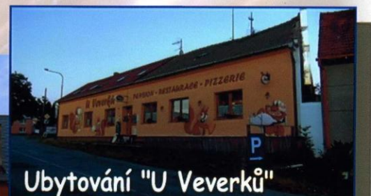
Ubytování "U Veverků"