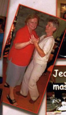
Kdo jsi se v lednu... únoru, atd. narodil