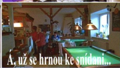
A, už se hrnou ke snídani...