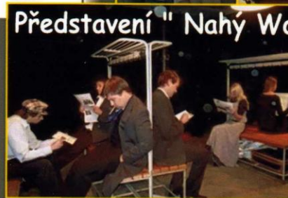
Představení "Nahý Walker"