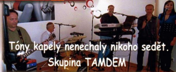
Tóny kapely nenechaly nikoho sedět. Skupina TAMDEM