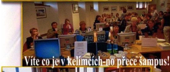
Víte co je v kelímčích - no přece šampus!