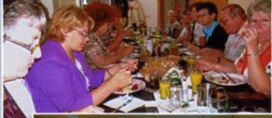
Poslední protivanovská snídaně

Vrtule smutně mrká - Protivanov se loučí s účastníky setkání CVKUaM - VII.