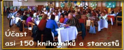
Účast asi 150 knihovníků a starostů