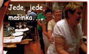
Jede, jede, mašinka...