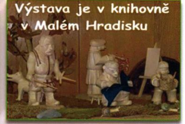
Výstava je v knihovně v Malém Hradisku