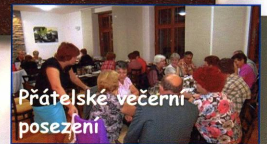
Přátelské večerní posezení