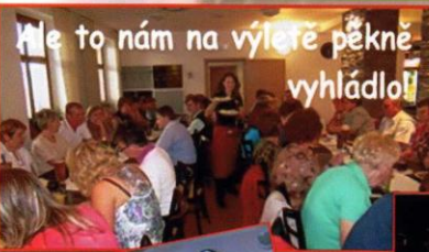
Ale to nám na výletě pěkně vyhládlol!

Vyhlášení soutěže o nejhezčí namalovanou tašku!