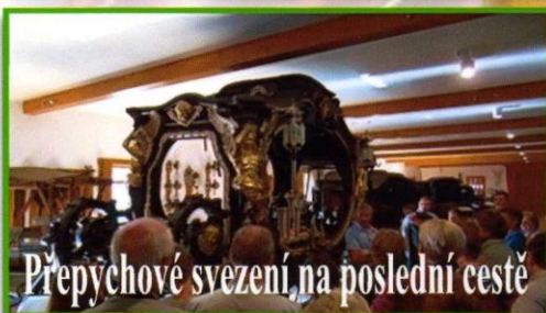
Přepýchové svezení na poslední cestě